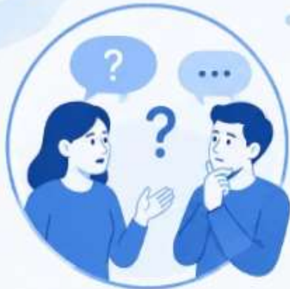
1. ПРОБЛЕМНЫЙ ДИАЛОГ