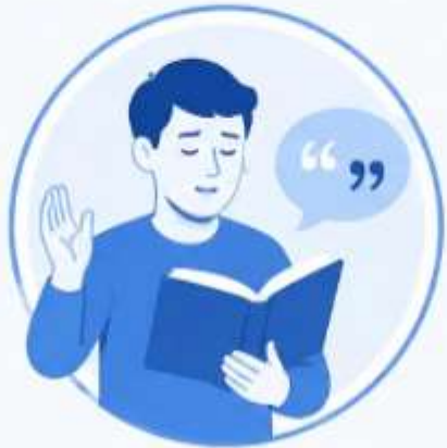
5. ВЫРАЗИТЕЛЬНОЕ ЧТЕНИЕ