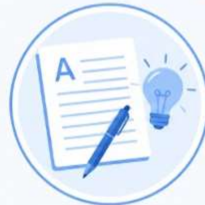
3. ЭССЕ И ТВОРЧЕСКИЕ ЗАДАНИЯ