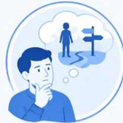
6. АНАЛИЗ НРАВСТВЕННОГО ВЫБОРА ГЕРОЯ