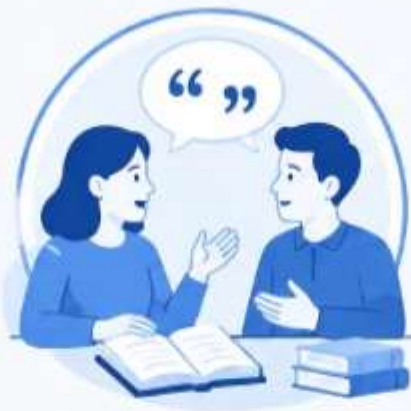
2. ЛИТЕРАТУРНАЯ ДИСКУССИЯ